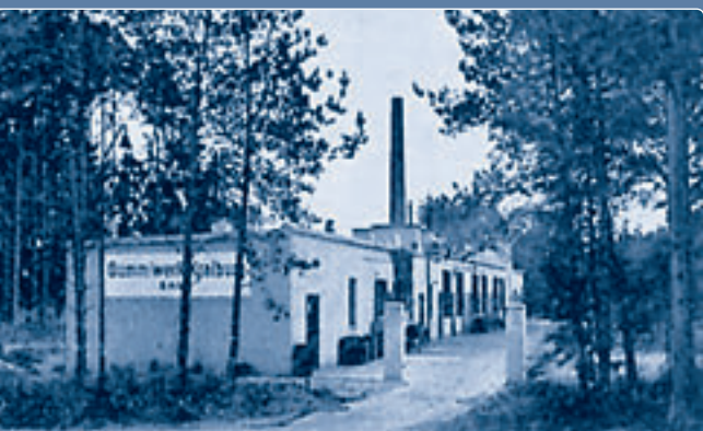
KRAIBURG a negyvenes évek végén