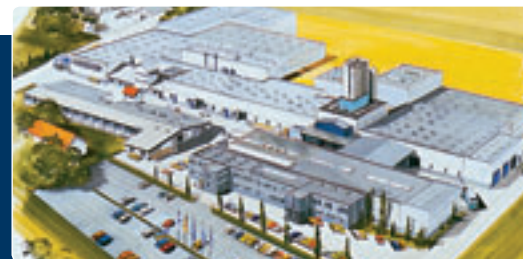
Az újrafutóanyagokat gyártó geretsbergi gyár