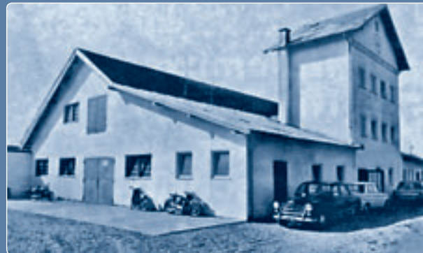
A geretsbergi gyár képe 1965-ben

Tittmoningban, majd 1971-ben a Gezolan AG-t Svájcban.