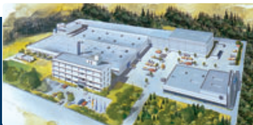
A központi gyártelep az igazgatósági épülettel