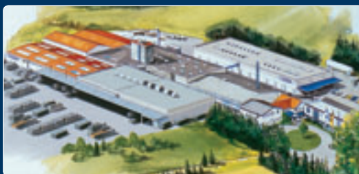
A gumihulladék-feldolgozással foglalkozó tittmoningi gyár A kék jelzőcsíkkal ellátott KRAIBURG futócsíkok