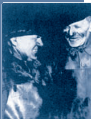
Az első munkatársak