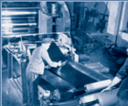
A régi kalandorsor