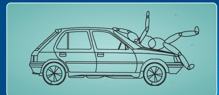
SZEMÉLYGÉPKOCSI-GYALOGOS BALESETEK REKONSTRUKCIÓJA