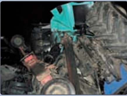
A baleset helyszíni képei