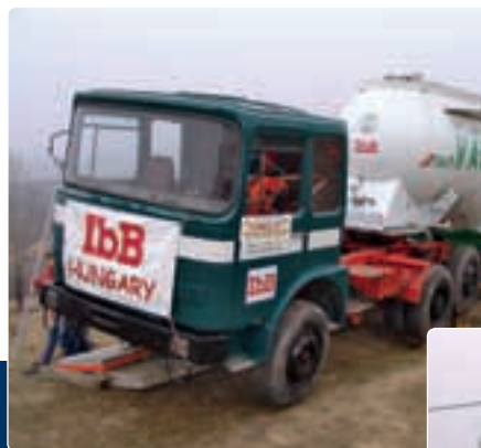
A borítási kísérlet előtt és után. A szervezők is nagyobb „durranásra” számítottak