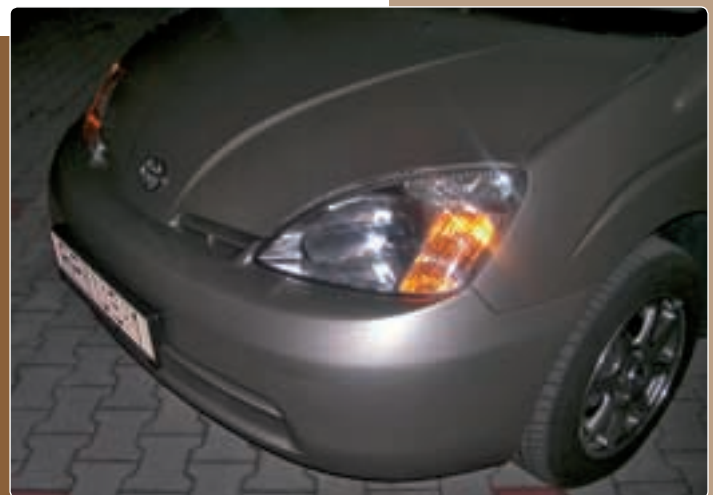
A hibrid hajtású új Toyota Prius