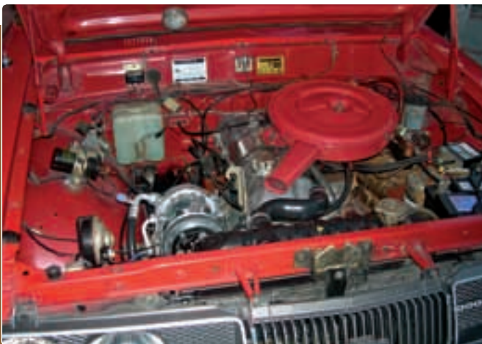
Egy veterán Toyota