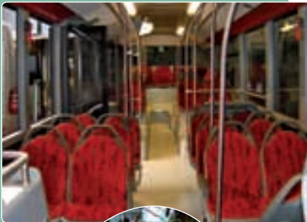
Citaro N belülről

Már hagyomány, hogy a hannoveri IAA után néhány héttel az ott kiállított Mercedes-Benz és Setra autóbuszokból ha nem is mindegyiket, de jó néhányat elhozunk a Best Bus Viennára. Ez nemcsak kiállítás, hanem egyúttal vásár is. Ezt a vásári oldalt erősítik a használt autóbuszok, amelyek között idén láthattunk négyéves Setra S 417 HDH turistabuszt, nyolcéves MB Citaro városi buszt, vagy éppen nyolcéves S 309 HD-t a 12 méter alatti buszok között. A kiállítás vásári jellegére utal, hogy a buszokat egy-egy tesztkörúton is ki lehetett próbálni.