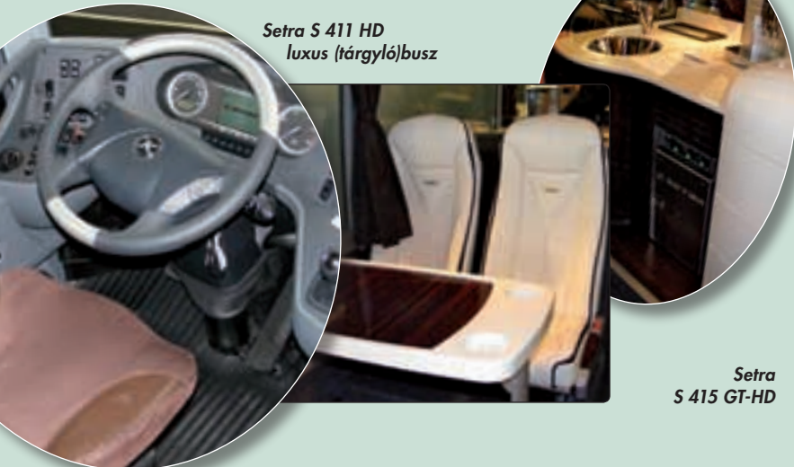
Setra S 411 HD luxus (tárgylo)busz