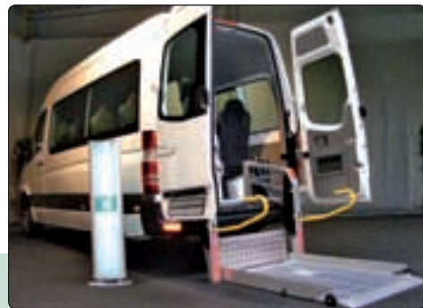
Sprinter Mobility 23 a mozgássérültek utaztatására

Ahol Mercedes-Benz és Setra buszok vannak, ott nem marad említés nélkül az OMNIplus, amely „szolgáltatás ott van, amerre ön jár”. Az OMNIplus egy autóbusz-specialista szolgáltatás gyűjtőneve, a szervizpartnerek közös célja nem keve-