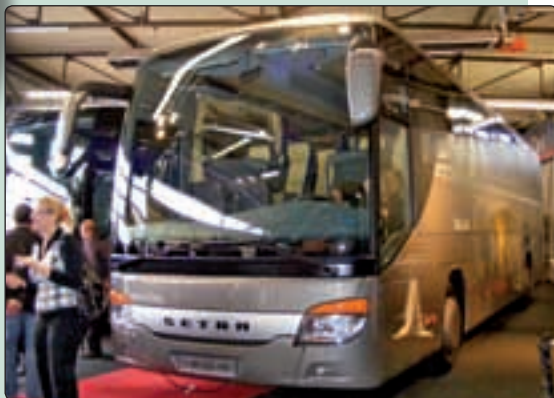
Setra S 415 GT-HD