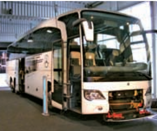
Az új Travego a Front Collision Guard védelemmel (FCG), az új műszerfal és a 19 colos képernyők

Aki nem jut el Hannoverbe, viszont kíváncsi az autóbusz-újdonságokra, kíváltképp, ha azok Mercedes-Benz vagy Setra márkájúak, akkor elkeseredésre semmi ok. A hiány pótolható a Best Bus Viennán, a Bécs melletti Wiener Neudorfban rendezett kiállításon.