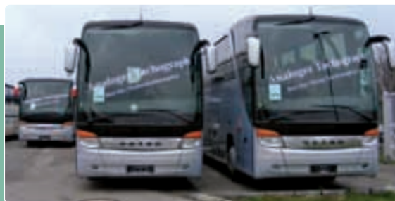
Az analóg tachográf még mindig jó ajánlólevél. előtérben a Setra S 416 HDH és S 417 HDH