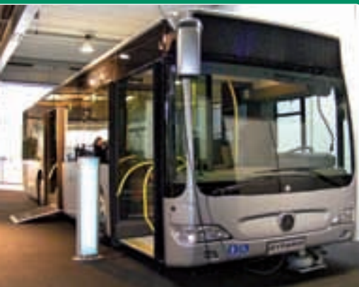
Citaro K kívülről