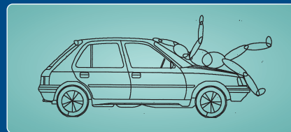
SZEMÉLYGÉPKOCSI-GYALOGOS BALESETEK REKONSTRUKCIÓJA