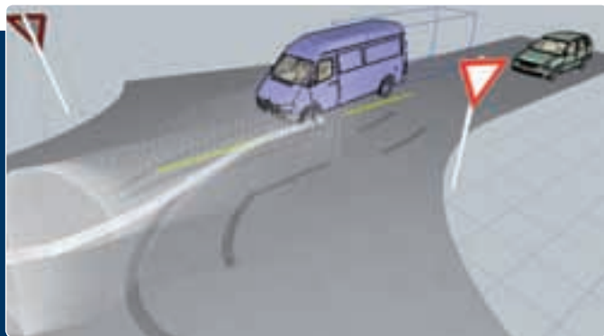
A három ábra a folyamatot szemlélteti időrendben

zott, egy olyan főútvonal jellegű úton, ahol nincs főútvonaljelző tábla. Viszont ismerte a terepet, tudta, hogy minden keresztutca „mackósajtós” táblával védett. Ment előtte egy kis dobozos tehergépkocsi, lassan, megfontoltan, talán 20 km/óra is volt a sebessége, egyelőre semmi nem mutatott arra, hogy irányt szeretne változtatni.