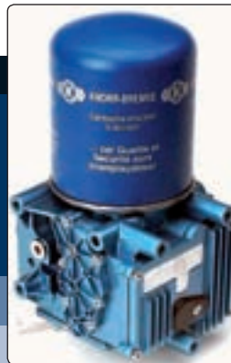
EAC (Electronic Air Control)

Miután az üzemi fékkörökben a hatóságilag megállapított fékhatáshoz elegendő nyomás kialakult, az „MV3” jelű