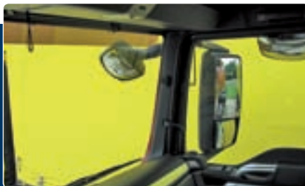
1–2. A jármű előtt álló férfi kívülről és a vezetőüléssel fényképezve