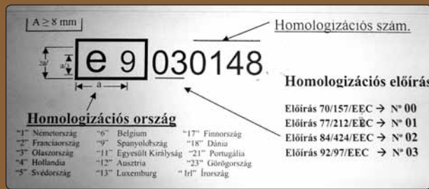
Európai jóváhagyási jel

– A jóváhagyási jel járműalkatrészen, tartozékon, illetőleg – járműtulajdonság esetén – a járművön való feltüntetésének, illetve használatának jogosságát az NKH ellenőrzi, és ha megállapítja a gyártás egyenletességének ellenőrzése, a felhasználás vagy üzemeltetés során, hogy magyar jóváhagyási jelet engedély nélkül használnak, a jóváhagyási jel használatát megtiltja, illetve a gyártót az engedélyezett típustól eltérő járműalkatrészen, tartozékon, illetőleg járművön azt használja, az engedélyt visszavonja.